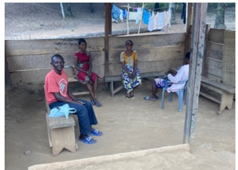
Wartezimmer in Krankenstation auf dem Land