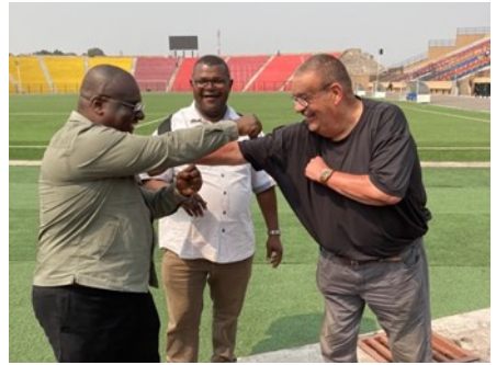
Nachgestellte Szene - Rumble in the Jungle 30.10.74 –G. Foreman & M. Ali – Stade du 20. Mai von Kinshasa