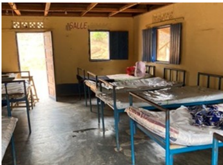
Krankenzimmer in Krankenstation