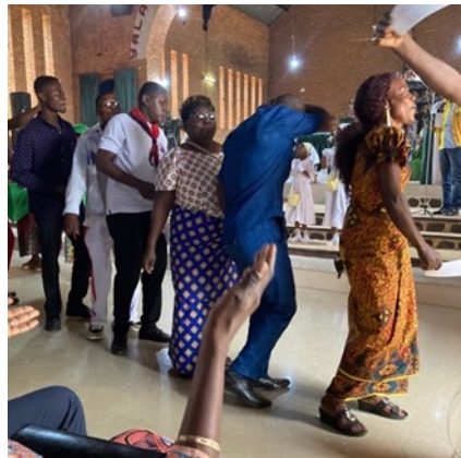
Tanzend bringen Gottesdienstbesucher ihre Kollekte zum Altar