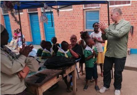
Besuch in einem Waisenhaus