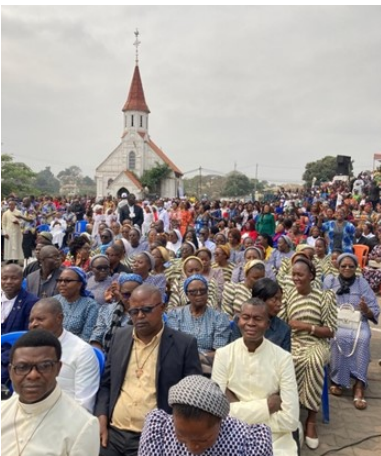
Priesterweihe in Boma – sechs Stunden Gottesdienst im Freien

Ich durfte von einem Spender aus Hüttenfeld zehn Laptops an Studierende verschenken – die Freude darüber war unbeschreiblich. Jede Spende an technischen Geräten, vor allem auch an medizinischem Gerät, kommt gut an, weil es oft am nötigsten fehlt. Ich bin dankbar in Deutschland zu leben und bewundere doch auch die Menschen dort. Ich kann verstehen, dass sich viele Afrikaner aus Perspektivlosigkeit auf den Weg machen, um nach Europa zu gelangen, um auch an unserem – auch auf Kosten der ärmeren Länder des Südens erworbenen – Wohlstand teilhaben zu wollen. Bundeskanzlerin a.D. Dr. Angela Merkel hat anlässlich der Vorstellung ihres Buches Freiheit durch Anne Will kürzlich im Fernsehen bei Phönix so davon gesprochen: „Ich schreibe auch in meinem Buch, ich habe jetzt auch so manches darüber gelesen, was so alles da drin steht in unserem Buch...“